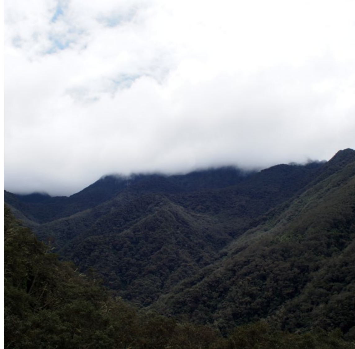
Luca Di Pietro, Valle Cocora (Colombia)